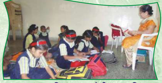
एकलव्य बालशिक्षण न्यास येथील अभ्यासिका