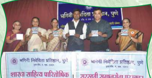
संस्थेच्या डी.व्ही.डी. चे प्रकाशन