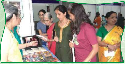
संस्थेत तयार झालेल्या वस्तूंचे प्रदर्शन