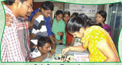
इ.१० वी चे विद्यार्थी - प्रयोग करताना