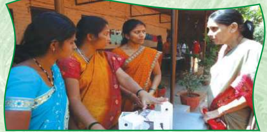
सोलर लॅम्प - पीसीबी असॅंब्ली