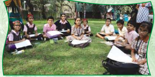
मूक-बधिर मुलांच्या स्पर्धा