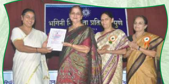
संस्थेतर्फे साहित्य व समाजसेवा पुरस्कार वितरण समारंभ