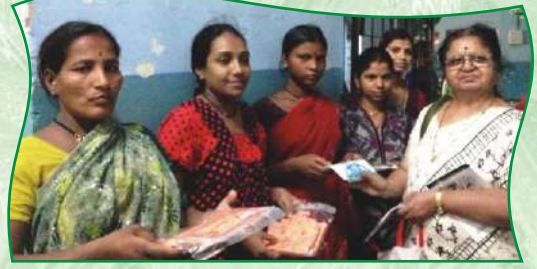
ससून येथील मातृ दुग्धपेढीतील बालकांना झबली टोपडी भेट