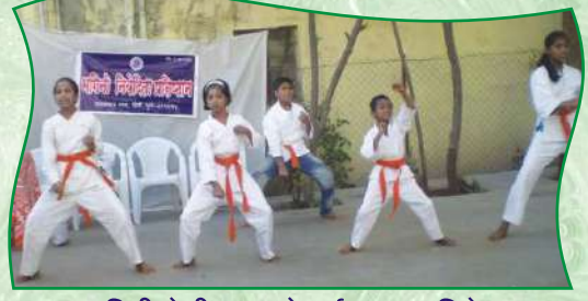
दिघी येथील कराटे वर्ग - प्रात्यक्षिके