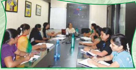
ऑरबिटल इलेक्ट्रोमेक कंपनी-स्टाफसाठी कार्यशाळा