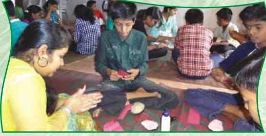
किशोरवयीन मुलांचे निवासी शिबीर