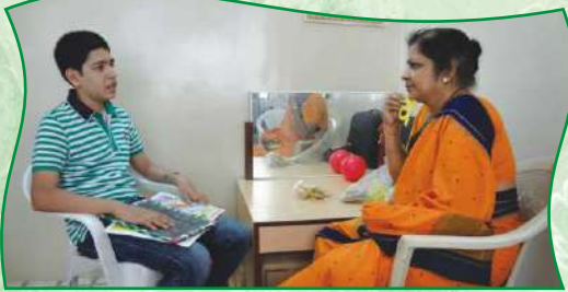
वाचा सुधार केंद्रात वाचा दोष सुधारण्यासाठी प्रशिक्षण