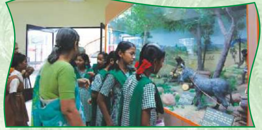
अभ्यासिकेतील मुलांची ऊर्जा पार्क येथे सहल