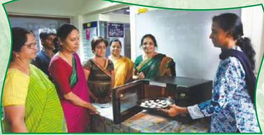
मायक्रोव्हेव रेसिपी क्लास / कुकरी क्लास