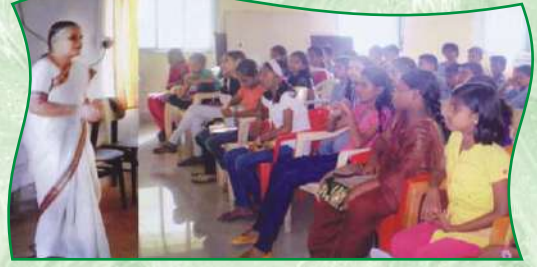
किशोरवयीन मुलांना मार्गदर्शनपर व्याख्यान