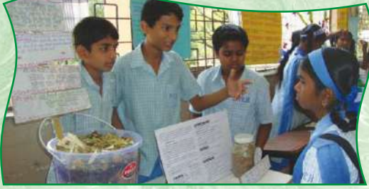
विज्ञान दिनानिमित्त विज्ञान प्रदर्शन