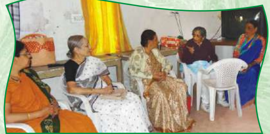
ज्येष्ठ नागरिकांची निवासी सहल - दिघी