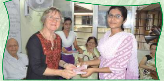
गरजू विद्यार्थ्यांना शैक्षणिक शिष्यवृत्ती