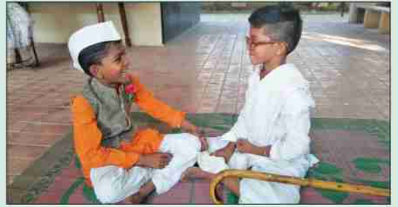
दिघी येथील सांस्कृतिक कार्यक्रमातील बालगोपाळ