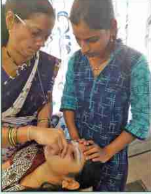
ब्युटीपार्लर कोर्सचे प्रात्यक्षिक