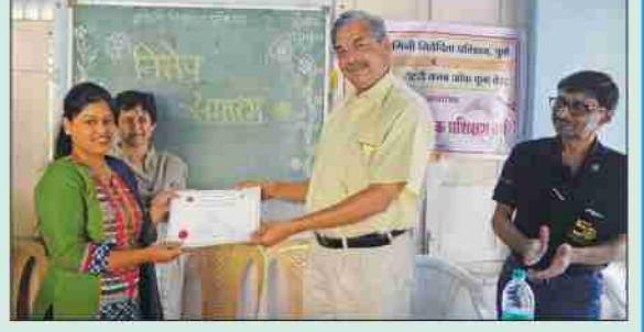
ब्युटीपार्लर कोर्सचे प्रमाणपत्र वितरण करताना रोटरी क्लबचे पदाधिकारी