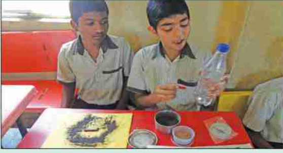
विज्ञान प्रदर्शनात सहभागी विद्यार्थी