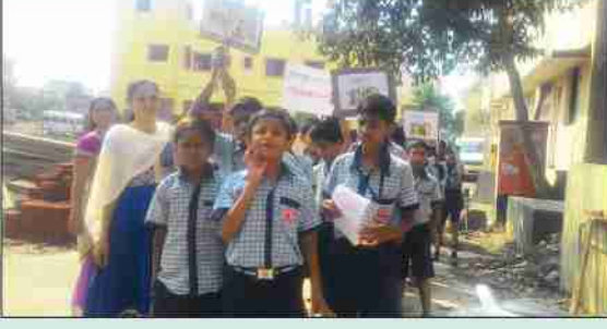
किशोरवयीन विद्यार्थ्यांची प्रभातफेरी