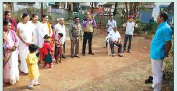
स्वातंत्र्यदिन - सांस्कृतिक कार्यक्रम