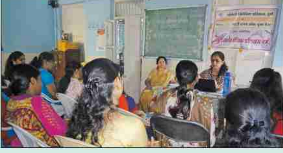
कौशल्यविकसन अंतर्गत ब्युटीपार्लर कोर्स