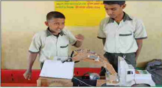
विज्ञान प्रदर्शनात सहभागी विद्यार्थी