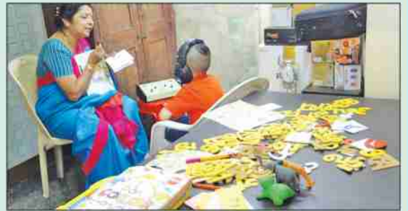
'शब्दसंस्कार' अंतर्गत कर्णबधिर विद्यार्थ्यांसाठी प्रशिक्षण