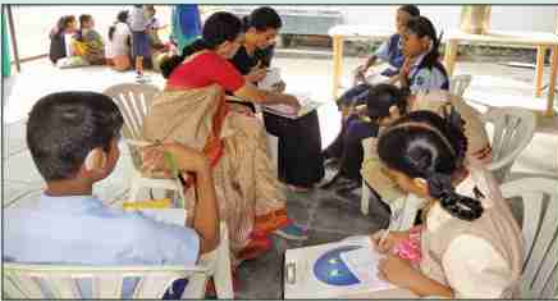
कर्णबधिर विद्यार्थ्यांसाठी स्पर्धांचे आयोजन