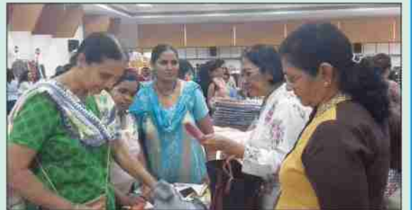
संस्थेत व्यवसाय प्रशिक्षणांतर्गत महिलांनी तयार केलेल्या वस्तूंच्या विक्रीचा प्रदर्शनातील स्टॉल