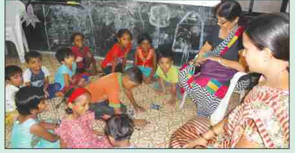
शिक्षक प्रशिक्षण - दिघी