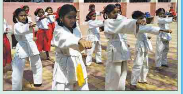
किशोरवयीन विद्यार्थ्यांना कराटे प्रशिक्षण