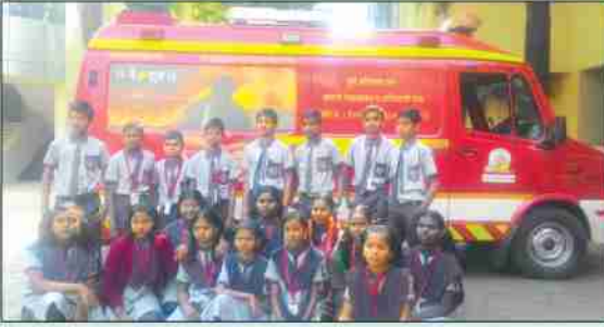
किशोरवयीन विद्यार्थ्यांची अग्निशमन दलाला क्षेत्रभेट