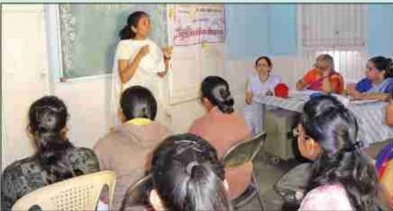
युवावर्गासाठी वक्तृत्व स्पर्धा