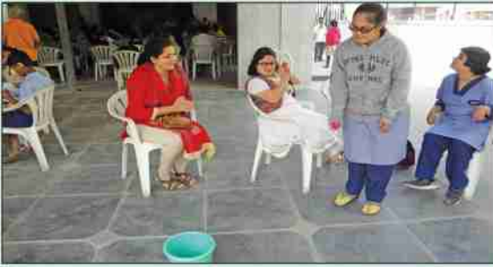
कर्णबधिर विद्यार्थ्यांसाठी स्पर्धांचे आयोजन