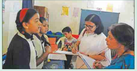
विज्ञान प्रदर्शनात सहभागी विद्यार्थिनी