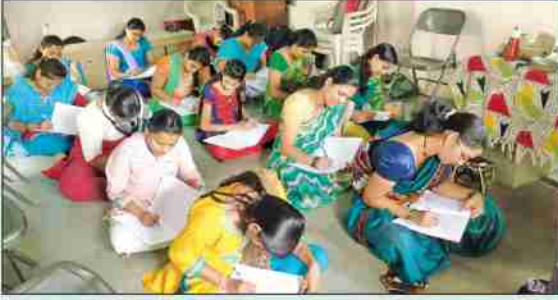
कौशल्यविकसन अंतर्गत प्रशिक्षण घेणाऱ्या महिला