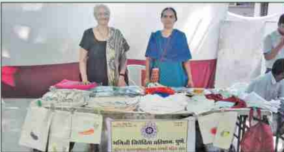
संस्थेत व्यवसाय प्रशिक्षणांतर्गत महिलांनी तयार केलेल्या वस्तूंच्या विक्रीचा प्रदर्शनातील स्टॉल