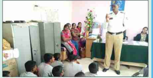
किशोरवयीन विद्यार्थ्यांची पोलीस स्टेशनला क्षेत्रभेट