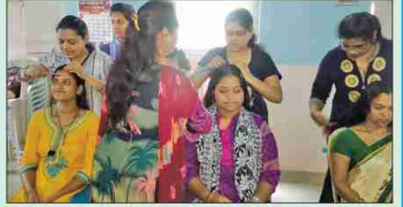
ब्युटीपार्लर कोर्सचे प्रात्यक्षिक