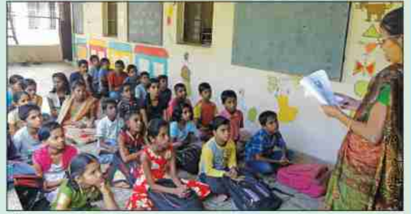
दिघी अभ्यासिकेतील शिक्षकदिन