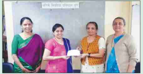
संस्थेतर्फे होतकरु विद्यार्थिनींना शिष्यवृत्ती