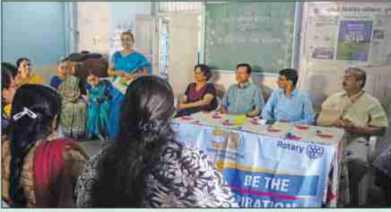
रोटरी क्लबच्या सहकार्याने दिधी येथे ब्युटी पार्लर कोर्सच्या उद्घाटन प्रसंगी रोटरी क्लब सदस्यांची संस्थेला भेट