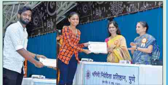
वक्तृत्व स्पर्धेचे पारितोषिक वितरण