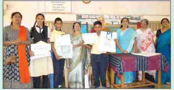
विज्ञान प्रदर्शनातील यशस्वी विद्यार्थी