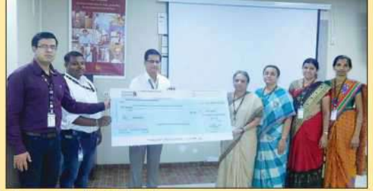
यु पी एस कंपनीची दिधी येथे भेट व कंपनीतर्फे देणगी