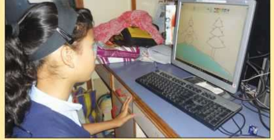
मूकबधीर विद्यार्थ्यांसाठी स्पर्धा