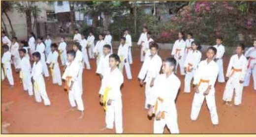
विद्यार्थी-विद्यार्थिनींसाठी कराटे प्रशिक्षण