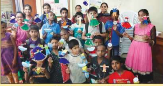
मूकबधीर विद्यार्थ्यांसाठी शिबीर