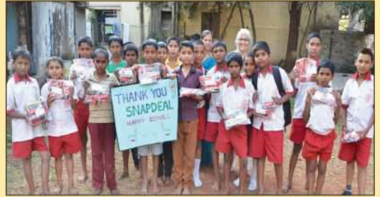
स्नॅपडील कडून भेट