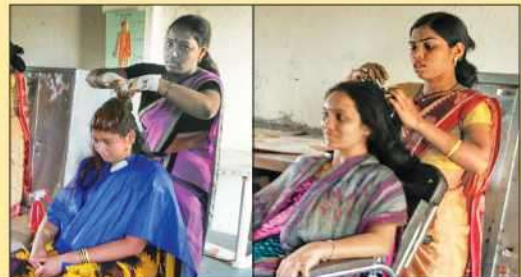
महिलांसाठी ब्युटिशियनचा कोर्स