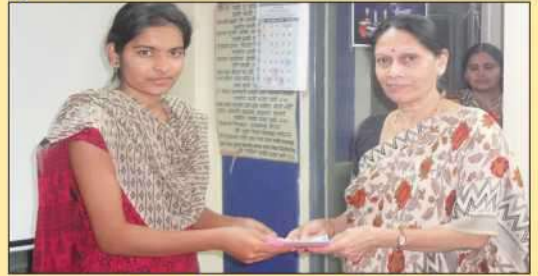
संस्थेतर्फे दिली जाणारी शिष्यवृत्ती